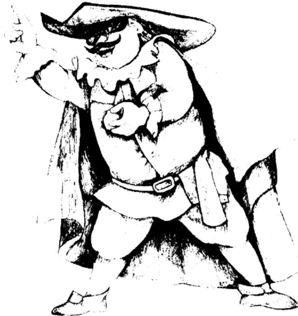
Doctor Balanzone. Ilustración de Giorgio Sansoni. @ Edizioni Primavera, Florencia,

Su nombre remite a la balanza —símbolo de la justicia—, ya que se vanagloria de ser un famoso representante de la ley. Siempre está a punto de subirse a la cátedra para aleccionar a los demás. Aunque sea para comentar el suceso más insignificante, recurre a largos discursos llenos de palabras latinas. Declara conocer a fondo la gramática, la lógica, el derecho, la filosofía, la física, la matemática y la geografía.