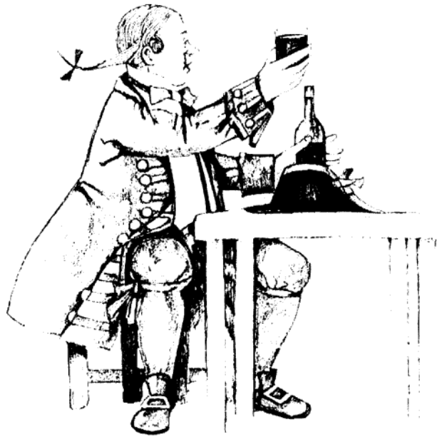
Gianduia, Ilustración de Giorgio Sansoni. @ Edizioni Primavera, Florencia,

»Le gusta visitar las diversas hosterías de la ciudad y su humor y alegría divierten a los presentes. No es bello pero sí simpático. Regordete de buen color, expresión un poco ingenua, siempre es fácil burlarse de él.»