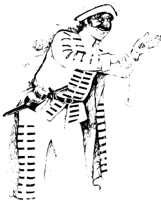
Brighella, Ilustración de Giorgio Sansoni. @ Edizioni Primavera, Florencia,