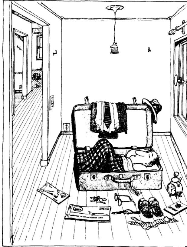
© Quino, Gente en su sitio, Editorial Lumen, Barcelona, 1986.

Mucho se ha hablado en el psicoanálisis acerca de cómo las personas esquizoides se desconectan de su necesidad del otro por la fantasía de que su magnitud sería inaceptable, incompatible con la vida, que su voracidad y dependencia las llevarían a «devorar» al otro; igualmente presente está el temor a ser devorado: su propia necesidad pondría a estas personas en situación de que el otro las utilizase, lo que no deja de ser verdadero: cuando entran en relación de dependencia se sobreadaptan al otro de tal forma que olvidan sus necesidades y precisan reconectarse con su mundo interno en la soledad. Al pensar que desear es demasiado, surge la resignación. Forma parte de este carácter decirse: «¿Vale la pena hacer un esfuerzo? ¿Vale la pena insistir?» Hay una pérdida de intensidad acoplada a una desesperanza. La resignación entraña apatía. Y ese «¿Vale la pena?» está ligado a su visión del mundo. Le parece que no va a encontrar nada profundamente satisfactorio. Anticipa el ser decepcionado como lo fue cuando pequeño.