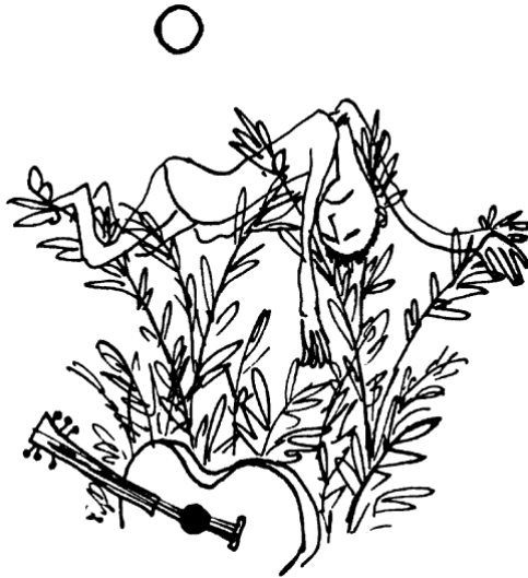
William Steig, Rejected Lovers.