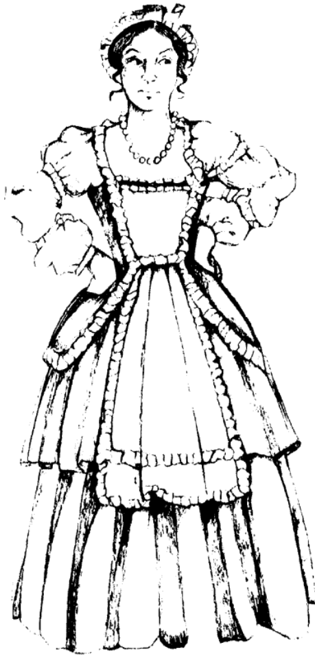
Colombina. Ilustración de Giorgio Sansoni.

El carácter orgulloso fue caricaturizado en la Comedia del Arte en la «máscara» de Colombina. Nos dice Carla Poesio en la obra Conoscere le maschere italiane 6: