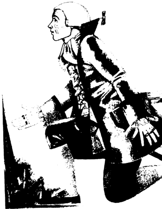
Florindo, Ilustración de Giorgio Sansoni.

»Su elocuencia está hecha de complicados discursos, de palabras bien buscadas, que sobrepasan el lenguaje de todos los días.»