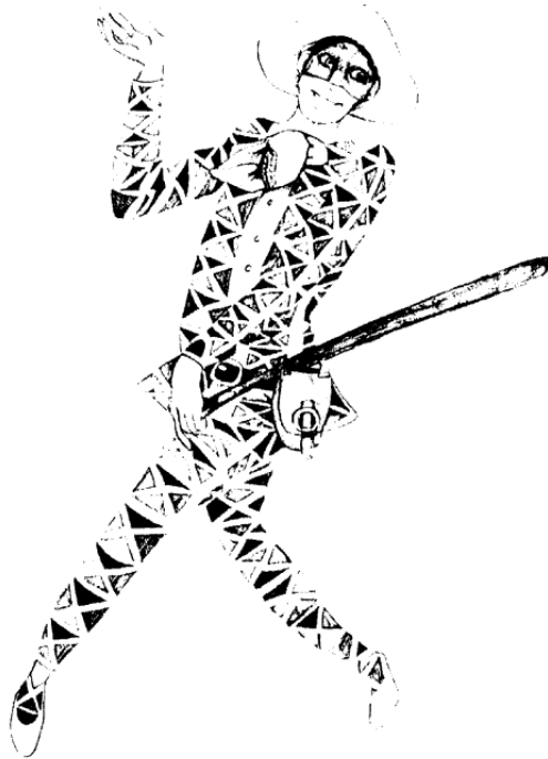
Arlecchino, Ilustración de Giorgio Sansoni. @ Edizioni Primavera, Florencia,

Es claro que ya en tiempos de la Comedia del Arte este tipo humano era bien conocido y lo encontramos en la simpática figura de Arlecchino. Así lo presenta Caria Poesio en su libro sobre las máscaras italianas 8: