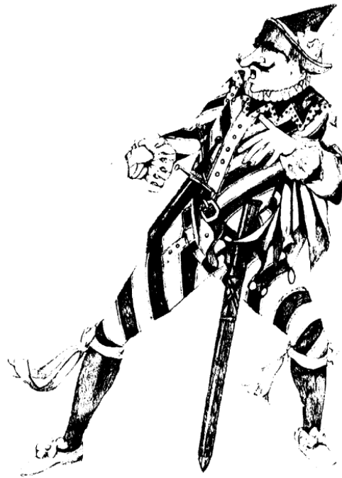
Capitán Spavento, Ilustración de Giorgio Sansoni. @ Edizioni Primavera, Florencia,

Sean cuales sean las empresas de este personaje, sólo él las puede contar, porque nadie jamás lo ha visto guerrear contra un enemigo verdadero. He aquí cómo amenaza a un adversario: «Si te pateo en el trasero, te mando derecho a Turquía, si no a quemarte el pelo en la esfera del sol.»